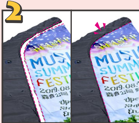
フレームと旗部分をファスナーで合わせて繋げます。