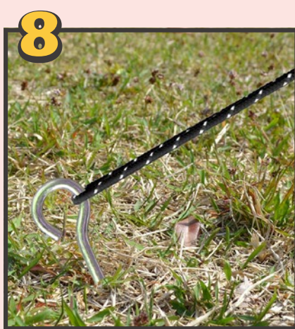
最後に付属のペグを地面に刺し、土台下部四方にある金具を引っ掛け、⑥で結んでおいたロープとペグを繋いで固定してください。