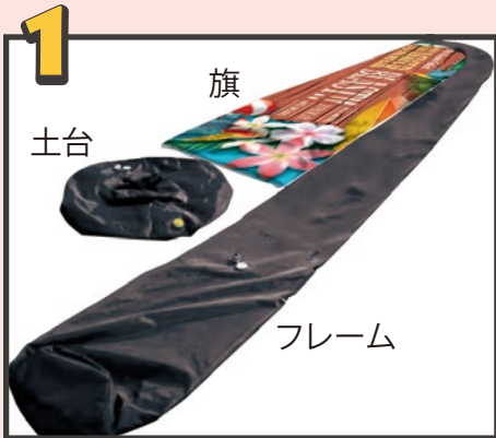
旗・フレーム・土台を用意します。