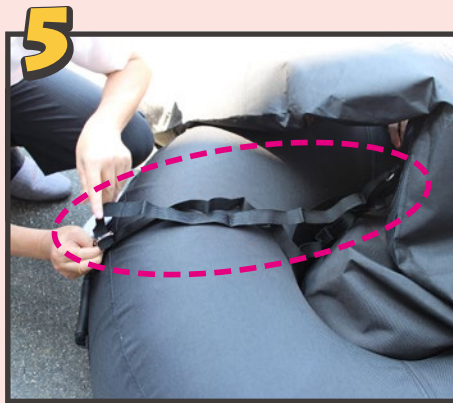
土台中央にフレーム下部を差し込み、接続ベルトを繋げます。