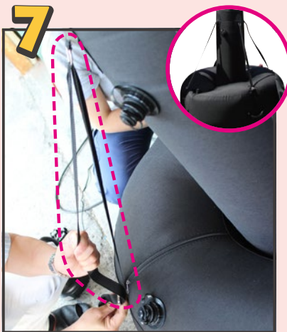
真っ直ぐに立つよう接続ベルトを調整しながら固定します。