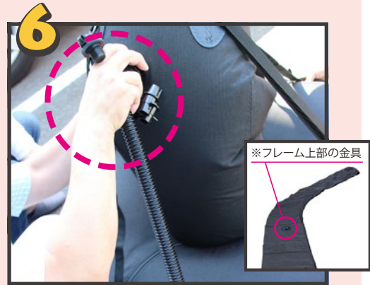
固定の為、フレーム上部3か所の金具に、予め付属のロープを結んでおきます。その後土台と同様の手順(③④)で膨らませ、空気を満タンにし、立ち上げます。