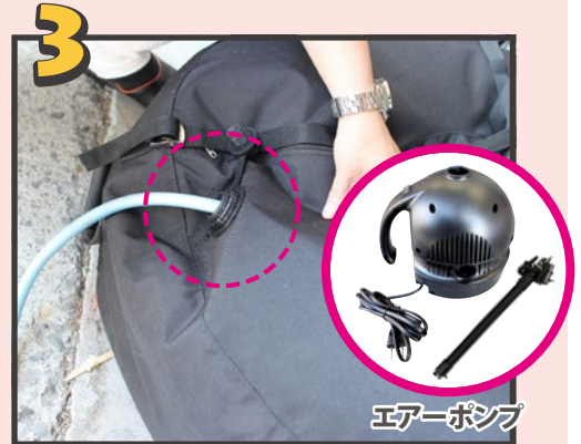
付属のエアポンプで土台に少し空気を入れて形を整え、水を20L入れます。